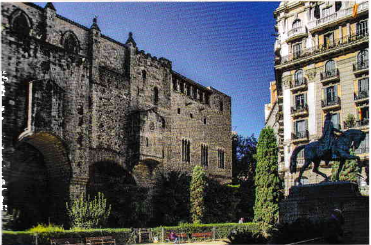
Foto: Zidurile vechi ale orașului, integrate în cele ale construcțiilor din Plaça del Rei

Deja conte de Cerdanya , Urgell , Girona și Besalú , Guifré el Pilós este numit și conte de Barcelona . Cel mai puternic conte al Marca Hispanica